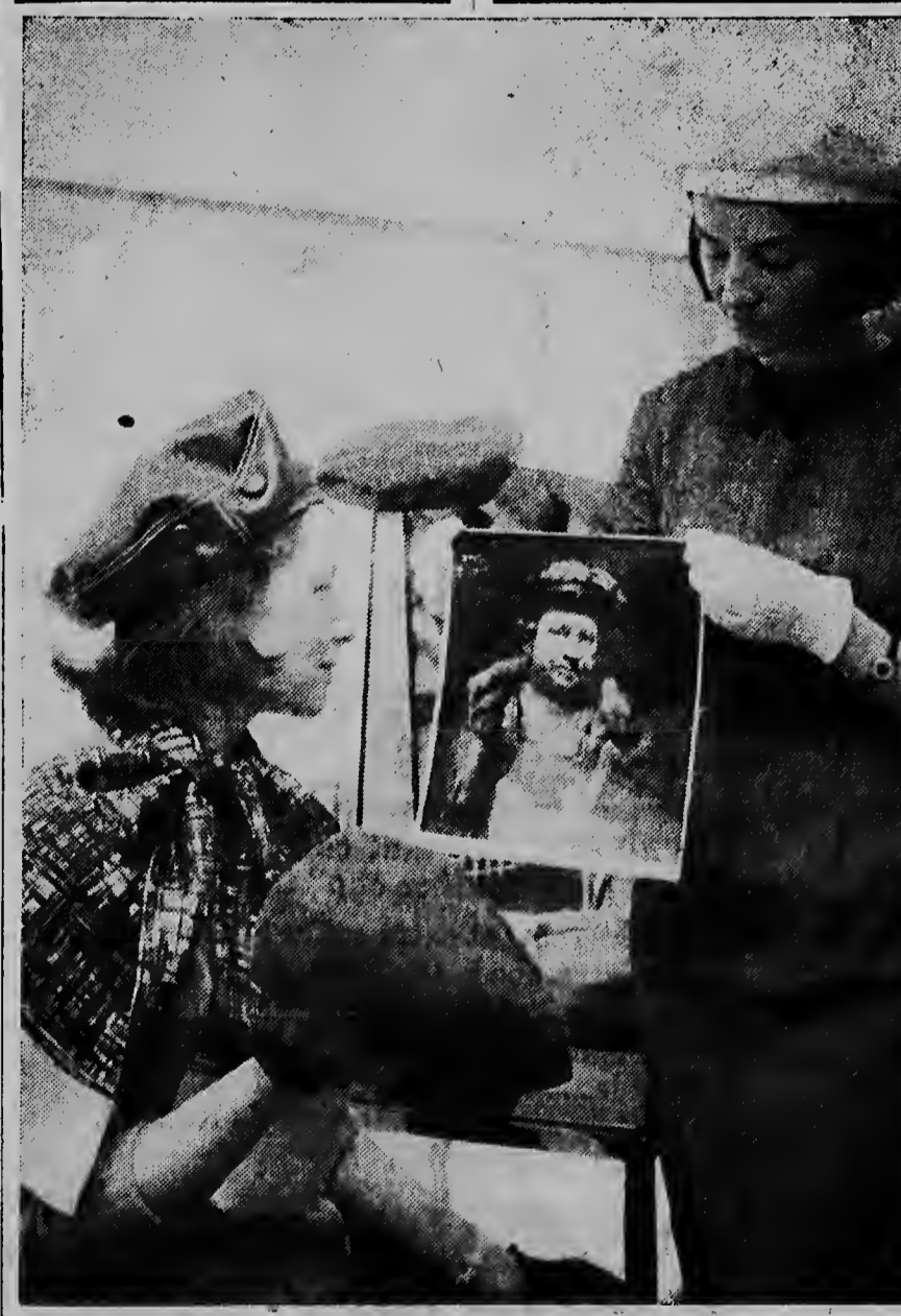
Aqui nos ta mira e damanan den modeshow na Stuttgart, camina tambe nan ta cerra conoci cu e sombre di Baret di mas nobo. Tambe e mironesnan por contempla cuadro di Straus durante nan ta cumpra nan cosnan.